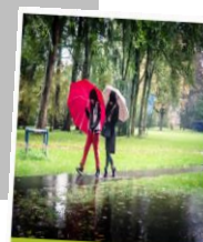
Factsheet resultaten onderzoek Mobility Mentoring® in gemeente Alphen aan den Rijn