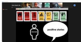
Kracht van positieve verhalen